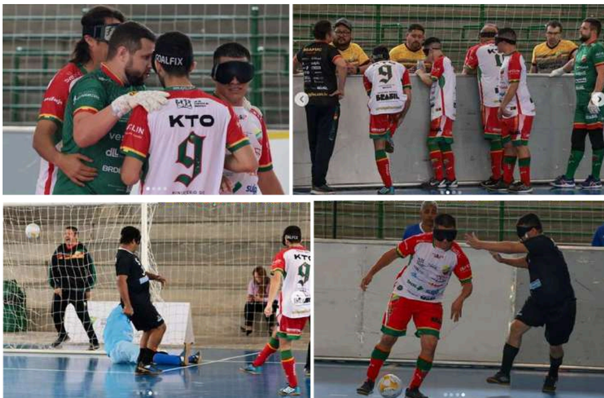
Fotos: evento Regional Sul-Sudeste de Futebol de Cegos