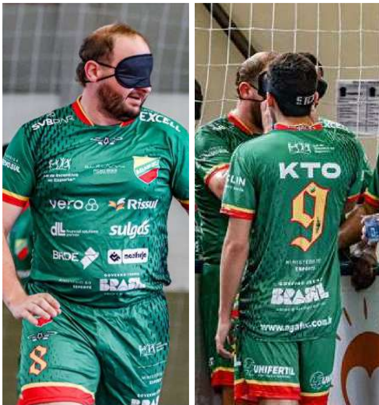
Uniforme - camiseta e bermuda (frente e verso)