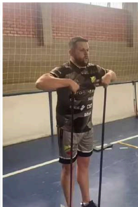
Fotos: exercícios de pré-treino