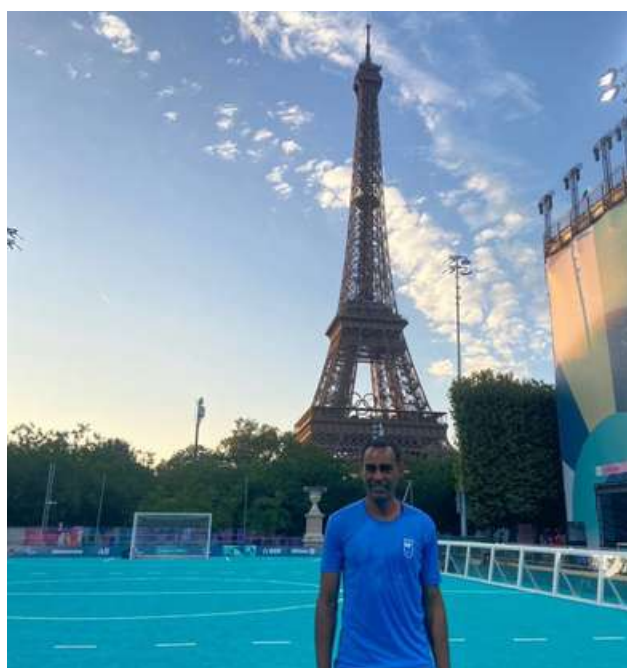
Foto: Atletas nos Jogos Paralímpicos de Paris 2024