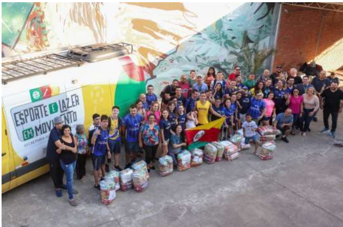
Foto: Atletas recebem cestas básicas da Secretaria Estadual de Esporte