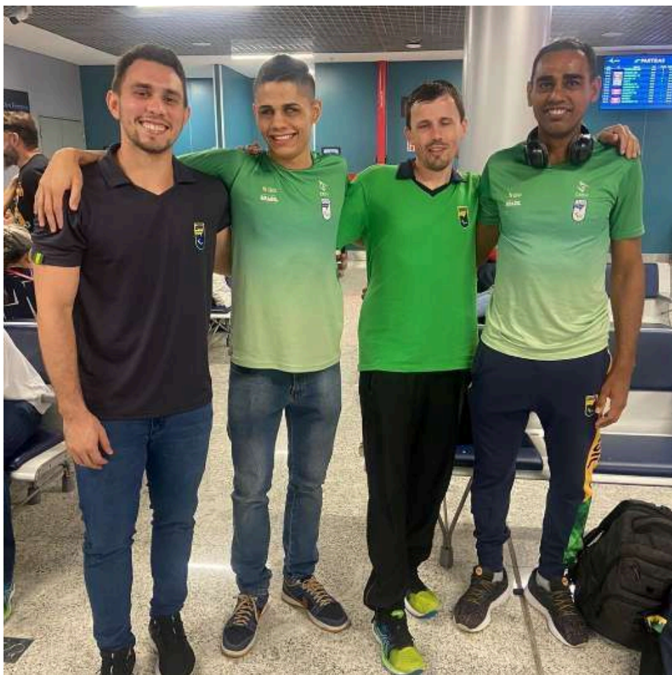
Foto: Atletas convocados para participar do Desafio Internacional de Futebol de Cegos