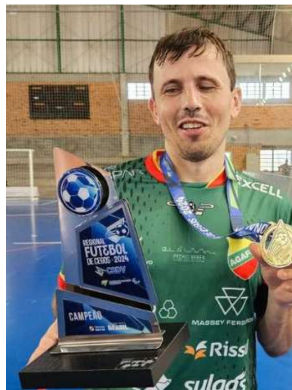
Fotos: evento Regional Sul-Sudeste de Futebol de Cegos