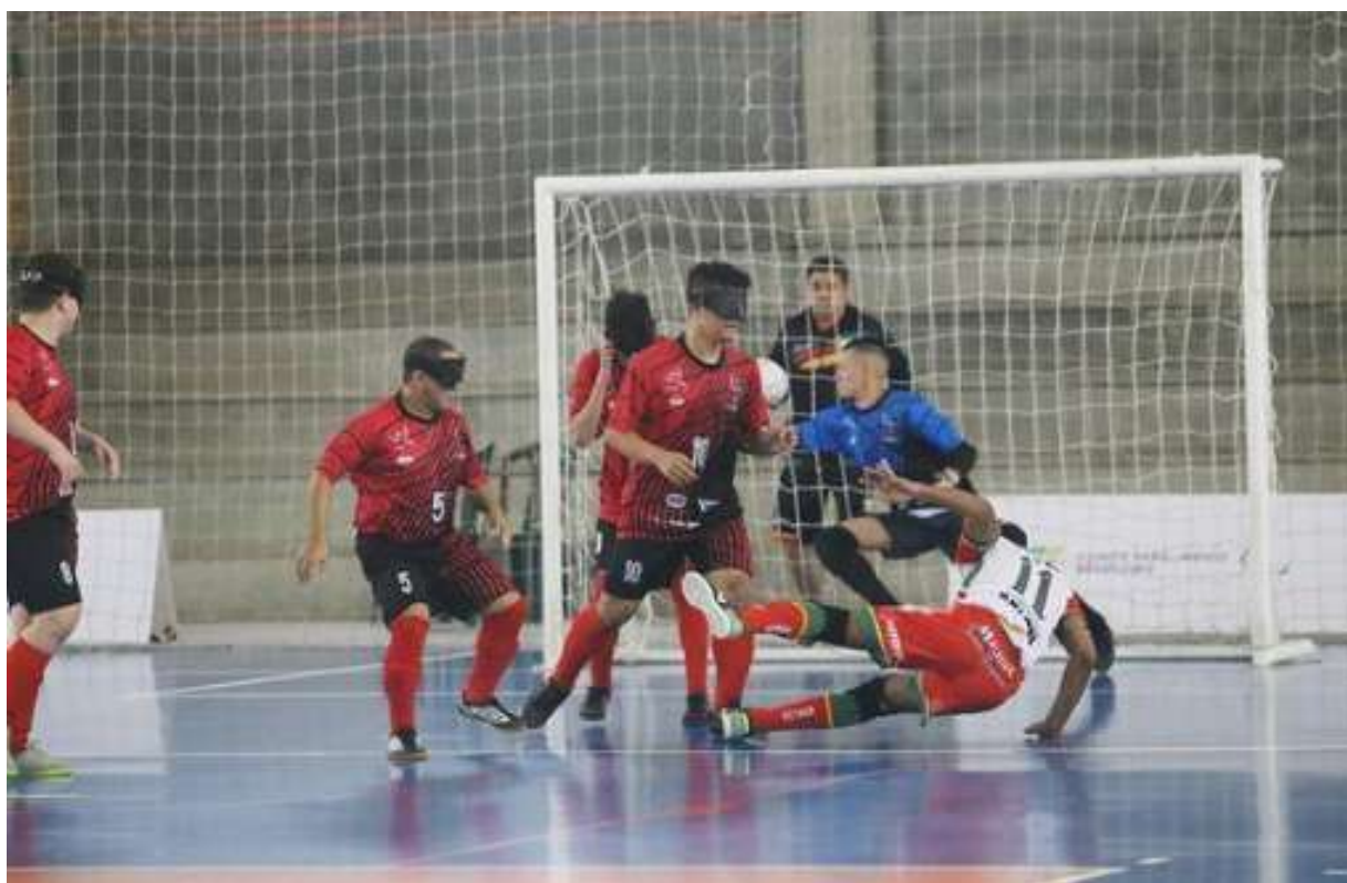
Foto: evento Regional Sul-Sudeste de Futebol de Cegos