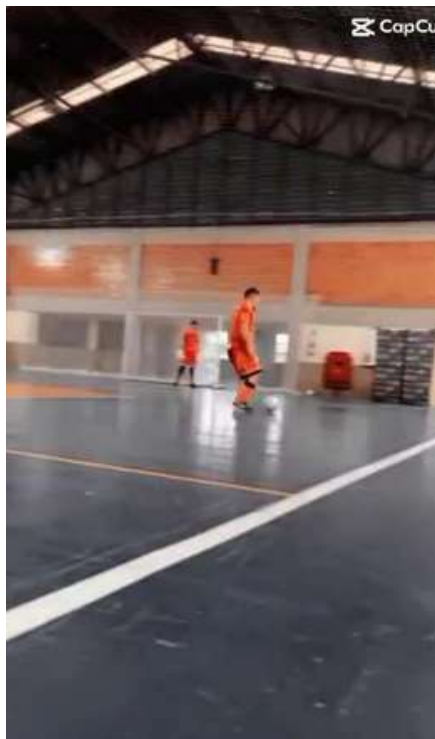
Fotos: Treinos diários do projeto