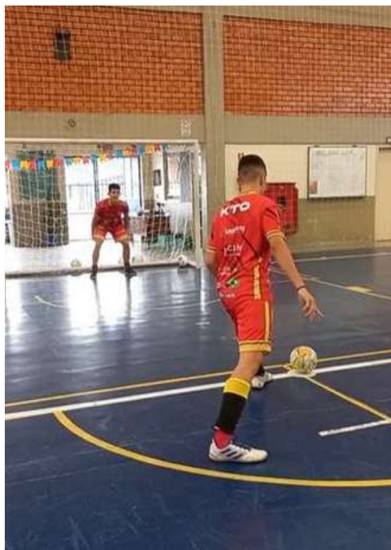
Fotos: Treinos diários