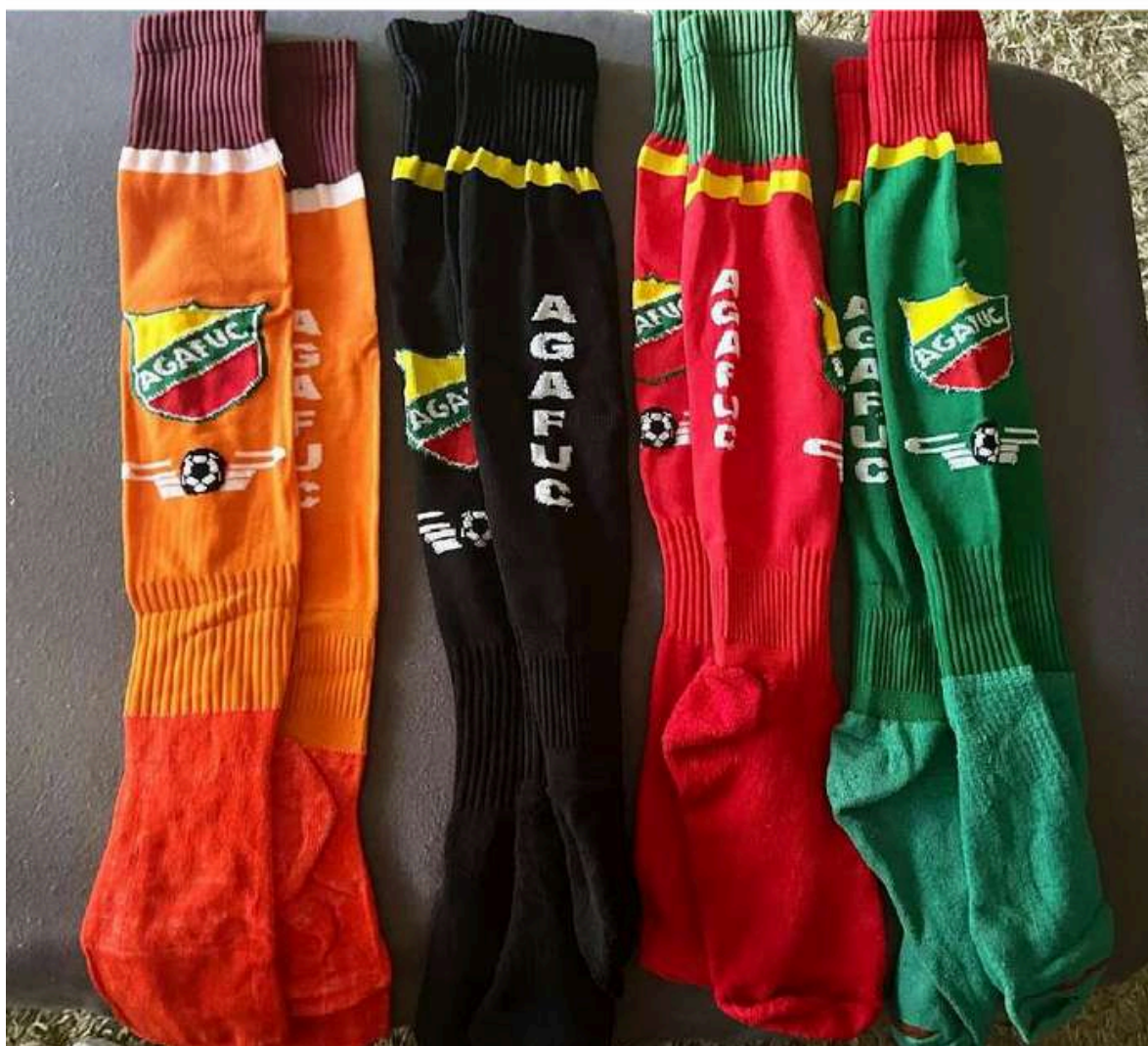
Fotos: materiais adquiridos através do projeto.