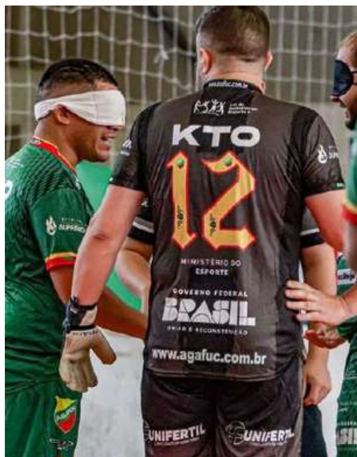
Fotos: Treino diário do projeto