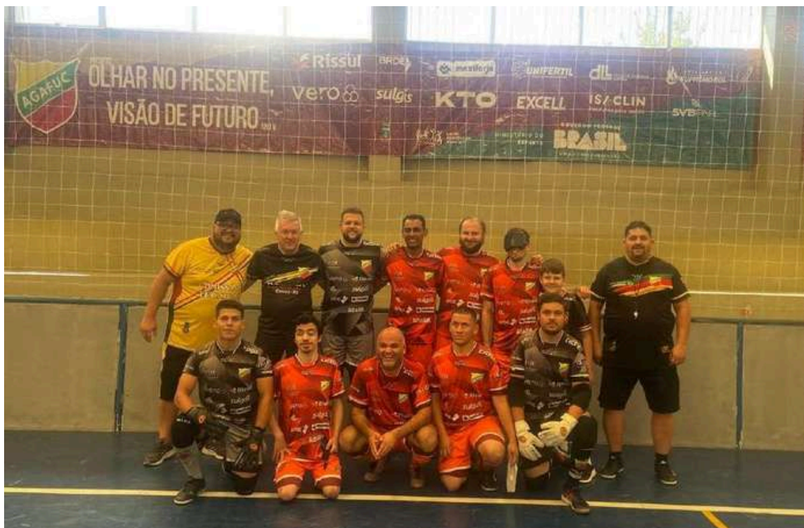
Foto: materiais adquiridos através do projeto.