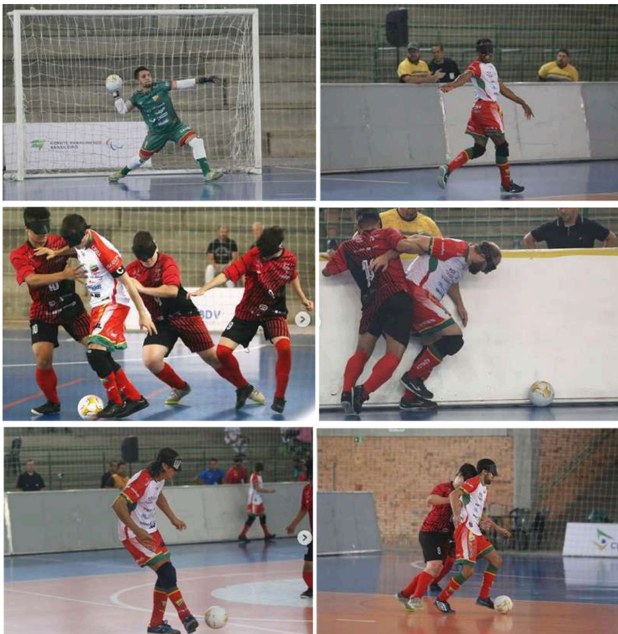
Fotos: evento Regional Sul-Sudeste de Futebol de Cegos