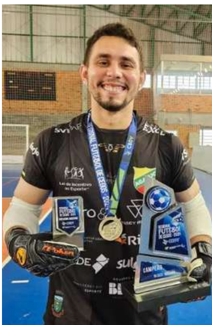
Fotos: evento Regional Sul-Sudeste de Futebol de Cegos