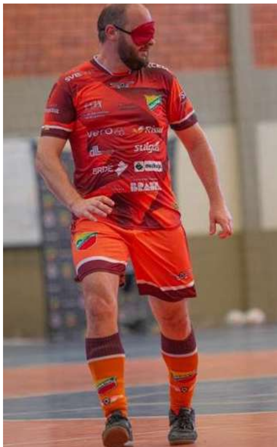
Fotos: Treino diário do projeto