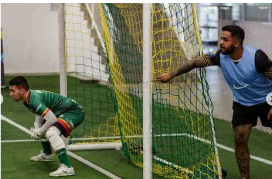
Fotos: evento Campeonato Brasileiro