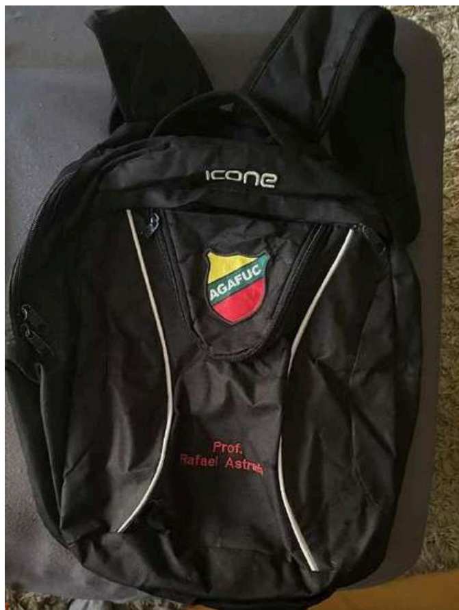
Foto: materiais adquiridos através do projeto.