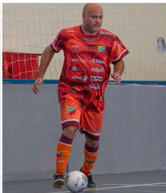
Fotos: Treino diário do projeto