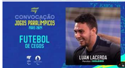
Foto: Convocação para representar o Brasil nos Jogos Paralímpicos de Paris 2024