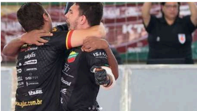
Fotos: evento Regional Sul-Sudeste de Futebol de Cegos