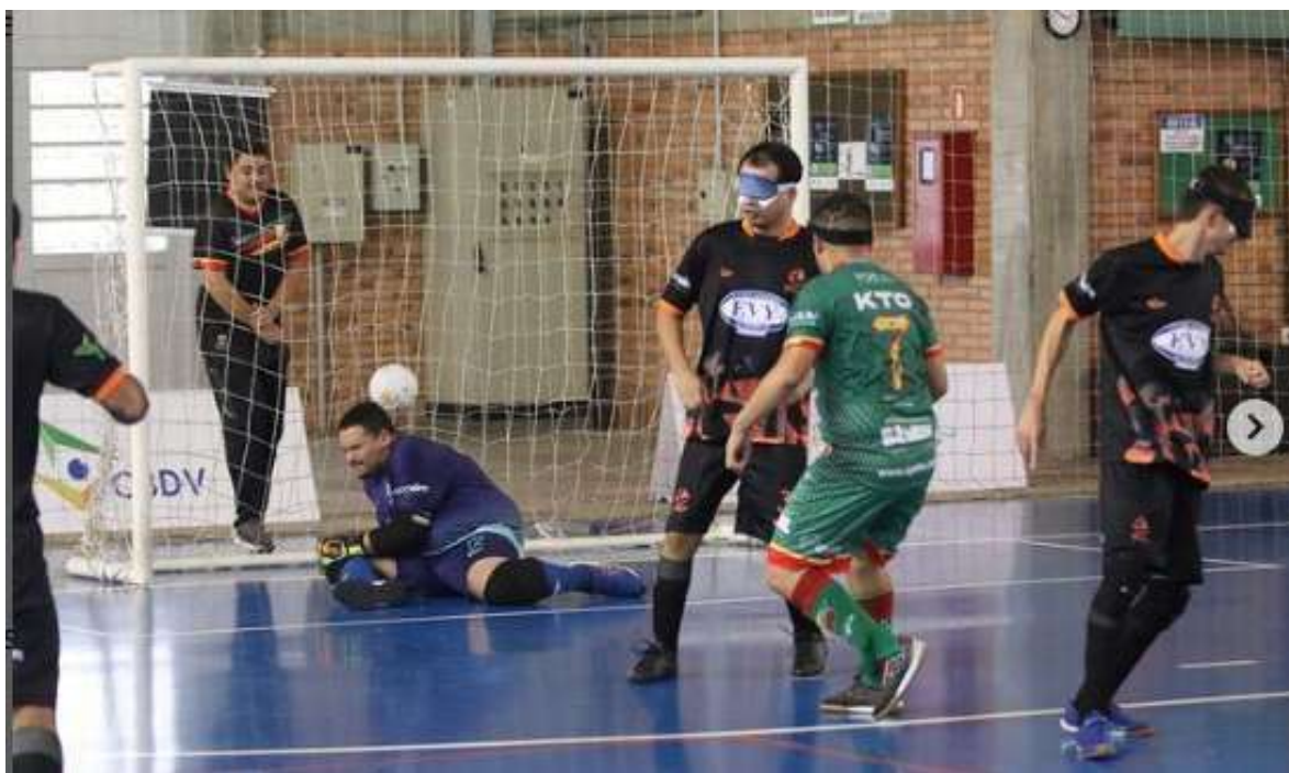
Fotos: evento Regional Sul-Sudeste de Futebol de Cegos