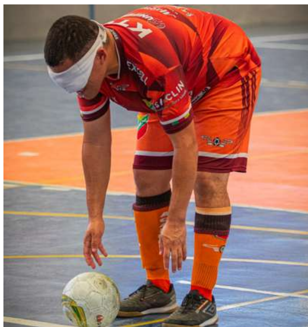
Foto: Palestra no Colégio João XXIII e retomada dos treinamentos regulares