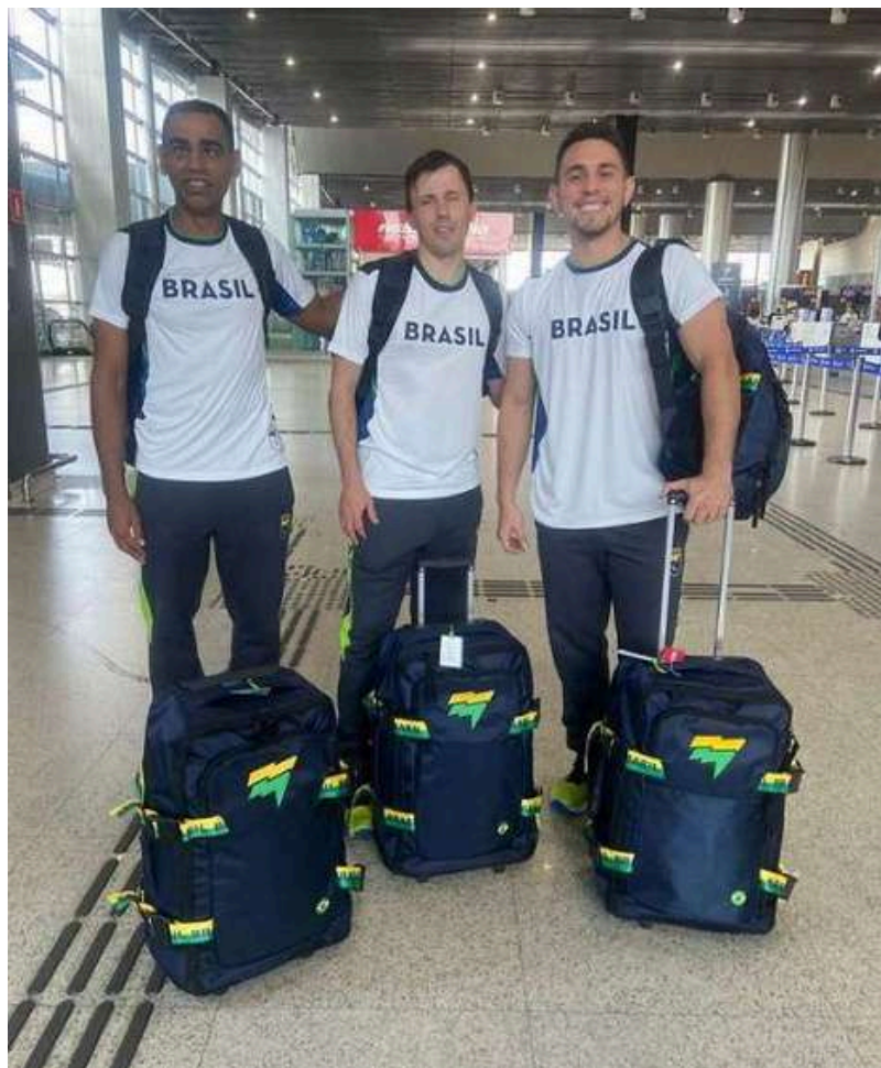
Foto: Atletas embarcando para os jogos Parapan-Americanos em Santiago