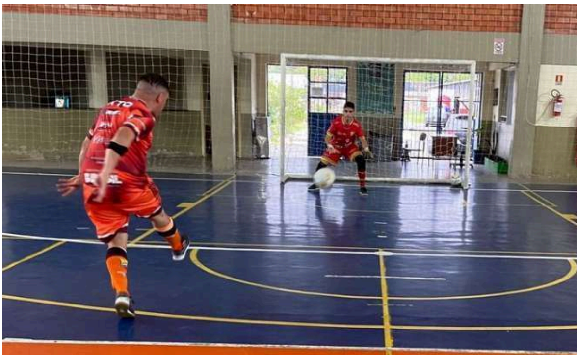
Foto: Treinos diários