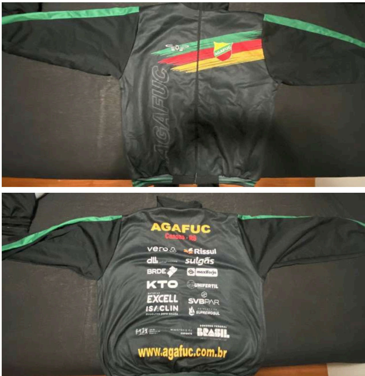
Agasalho - blusa (frente e verso)