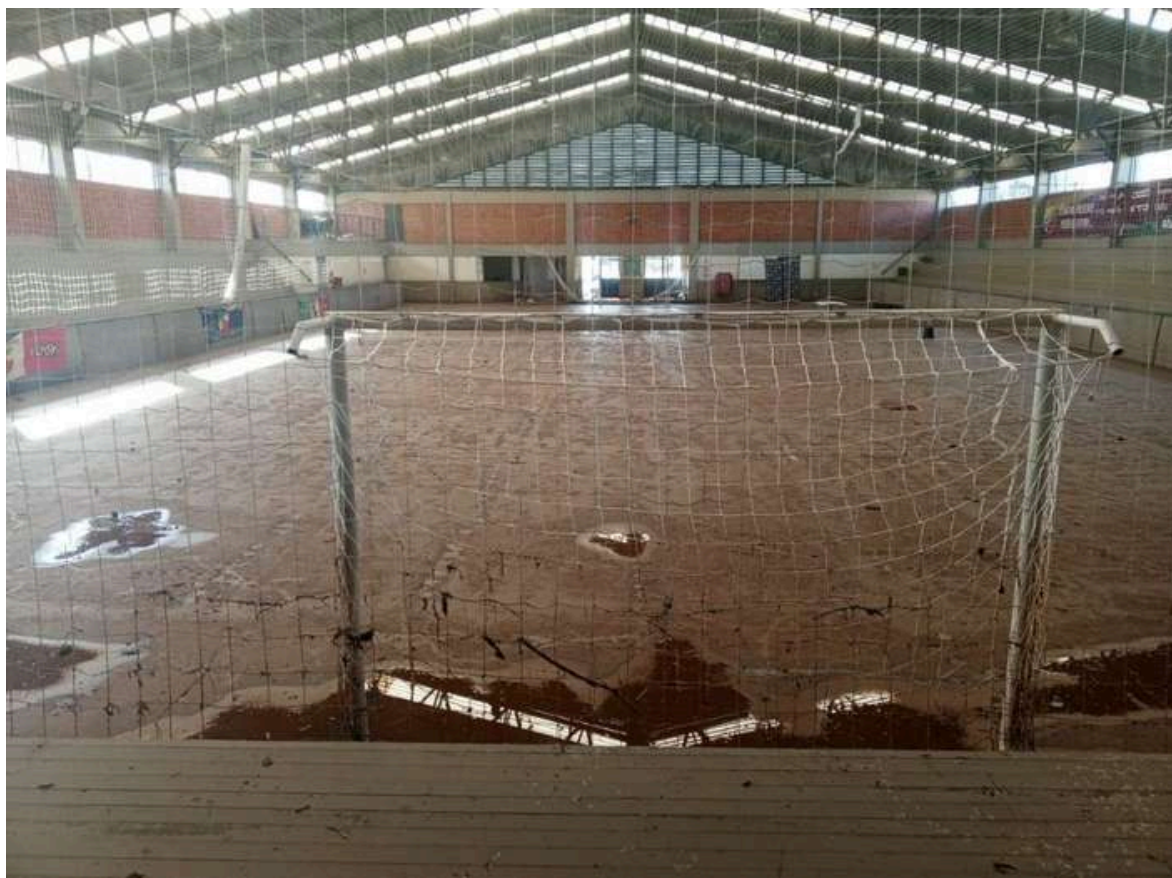
Foto: Quadra de treinamento após a enchente